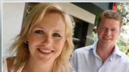
Uitzendbureau Polned begrip in de Kempen