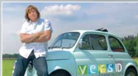
Vander Mark wordt versID