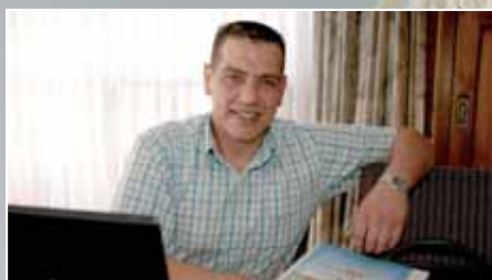
ClimaBox komt naar Nederland