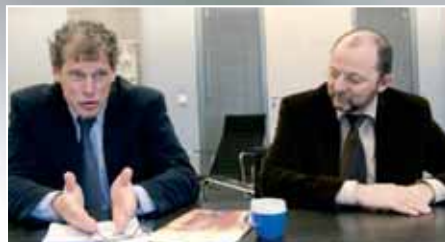
Arbeidsmarkt flexibel benaderen